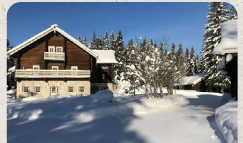
Lomakyla Onnenvirta Finland