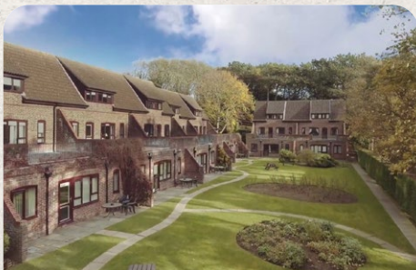
Cromer Country Club Norfolk East Anglia England

18.02. - 25.02. / 25.02. - 04.03. / 04.03. - 11.03.