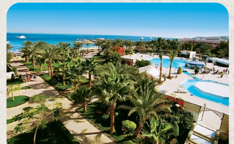
Regina Beach Hurghada Egypt