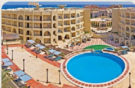
Mirette Touristic Village Hurghada Egypt

18.02. - 25.02. / 25.02. - 04.03. / 04.03. - 11.03.