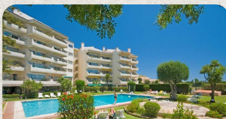
Oasis Village Algarve Portugal

18.02. - 25.02. / 25.02. - 04.03. / 04.03. - 11.03.