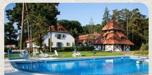
Club Abbazia Hungary