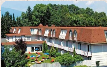
Arkadia Ferien Domizil Warmbad-Villach / Austria