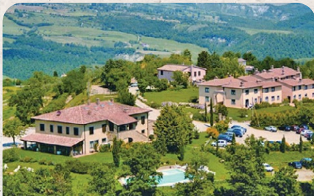
Il Poggio Bed & Breakfast Tuscany Italy