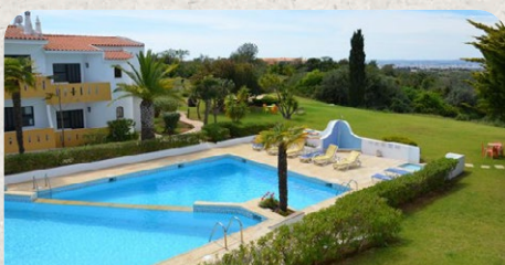
Ponta Grande Carvoeiro Algarve Portugal

18.02. - 25.02. / 25.02. - 04.03. / 04.03. - 11.03.