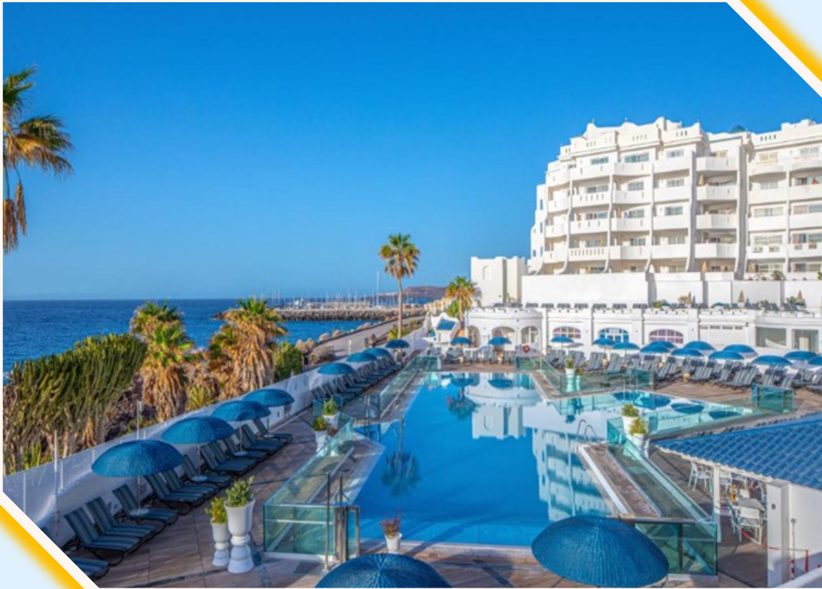
Santa Barbara Golf and Ocean Club.

V auguste 2024 ponúka Booking týždňový pobyt v apartmáne pre 6 osôb za cenu 1800 Eur Program Vacation generuje to isté cez Bonus Week za cenu 1000 Eur !