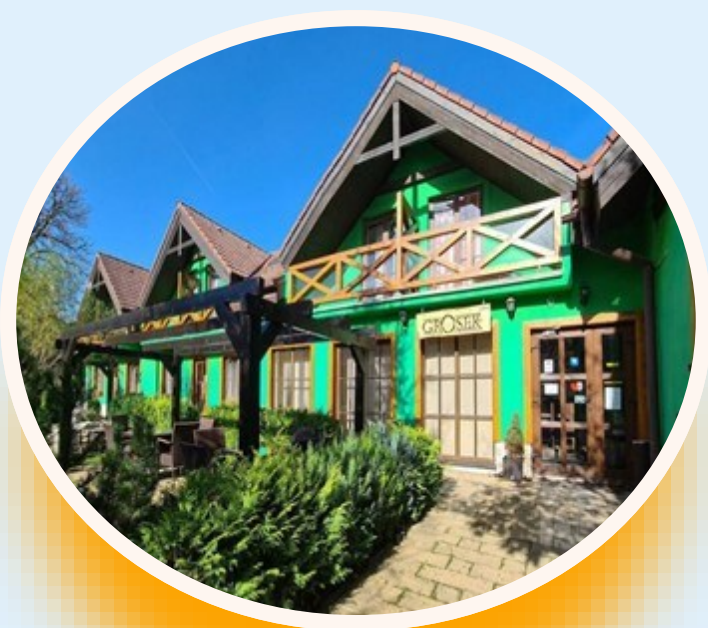
Penzión Grosek, Vyšné Ružbachy, rok 2015

Počas celého života som sa snažil hľadať nejaké investície resp. nejaké produkty, ktoré by boli zaujímavé nielen svojim obsahom či výnosom, ale aby prinášali nejakú pridanú hodnotu či už mne osobne, alebo mojím blízkym.