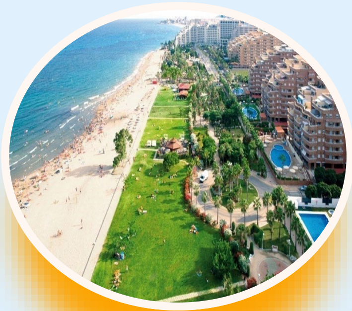
Marina d'Or, Oropesa del Mar, Španielsko 2017

No a takto nejako začalo moje prvé koketovanie s myšlienkou stať sa členom Tradičného Družstva.